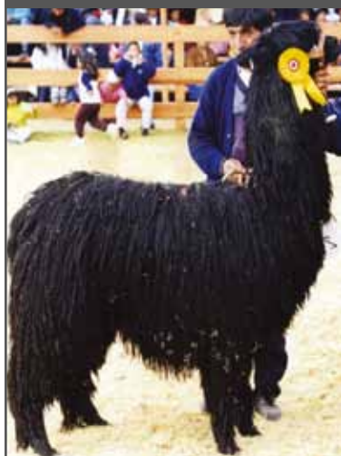
Figura 65. Buena cobertura (suri)