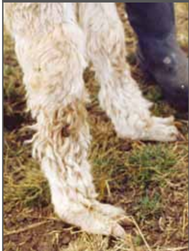
Figura 24. Largo de cuartilla (sentado)