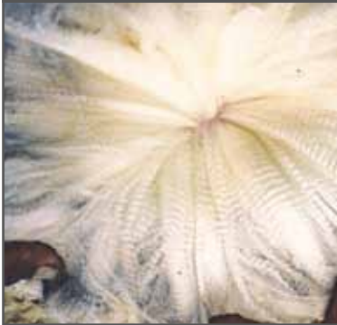
Figura 45. Fibra extrafina de excelente calidad, vellón denso