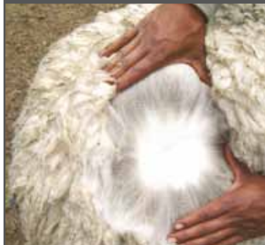
Figura 49. Fibra media de poco carácter, vellón denso