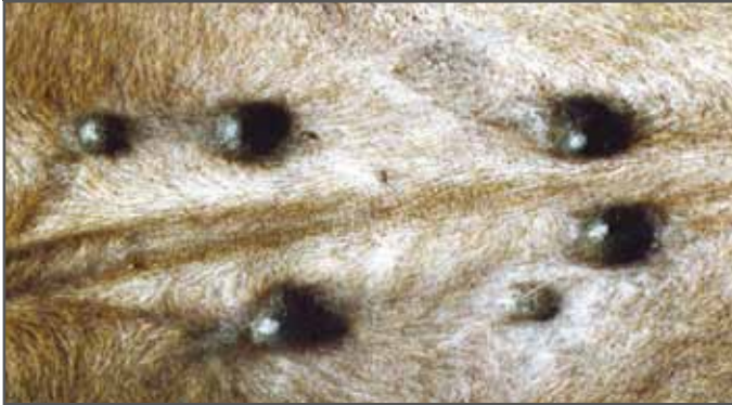
Figura 30. Pezones supernumerarios