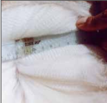
Figura 47. Fibra fina de buen carácter, vellón denso