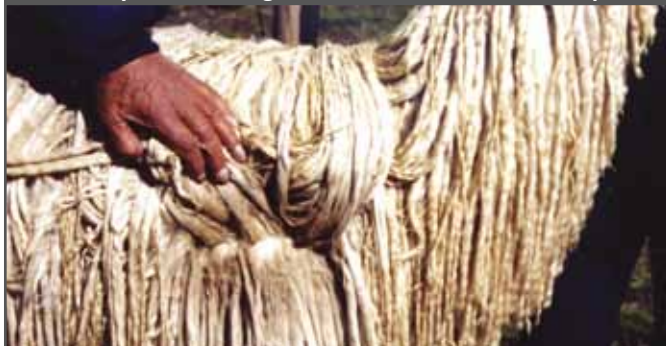
Figura 59. Fibra media sin lustre, vellón poco denso y mechadas gruesas poco organizadas