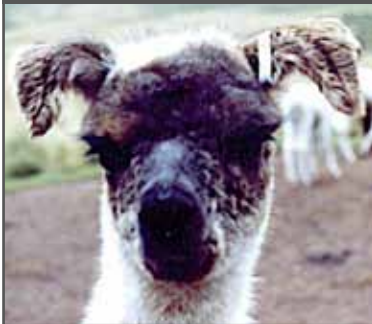
Figura 16. Orejas deformes y dobladas