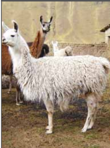
Figura 25. Miembros anteriores cortos remetidos (llama)