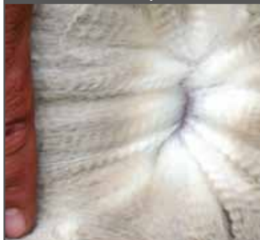
Figura 51. Fibra gruesa de buen carácter, vellón poco denso