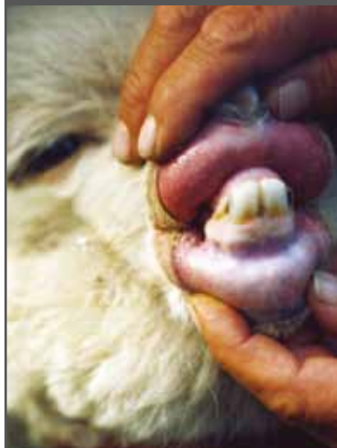
Figura 31. Dientes de leche