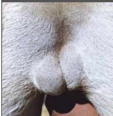
Figura 8. Hipoplasia unilateral