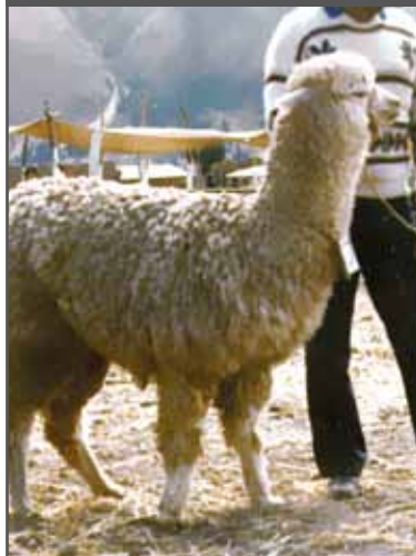
Figura 64. Mala cobertura (huacaya)