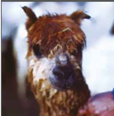
Figura 14. Oreja corta y doblada (alpaca)