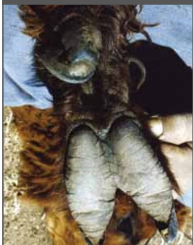
Figura 26. Polidactilia