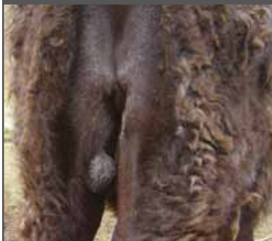
Figura 12. Testículo ectópico