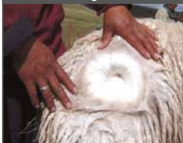
Figura 55. Grupa del animal de la figura 54