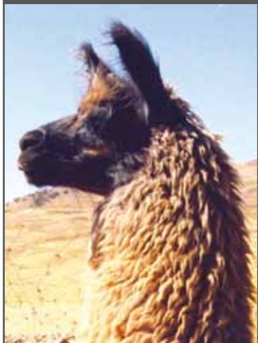
Figura 74. Cabeza buena