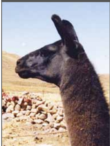
Figura 76. Cabeza buena