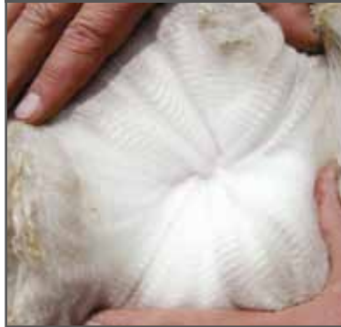
Figura 46. Fibra extrafina de excelente calidad, vellón denso