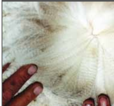
Figura 50. Fibra gruesa de buen carácter, vellón denso