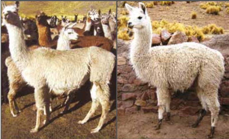
Figura 29. Cola torcida (izquierda) y colas normales (derecha)