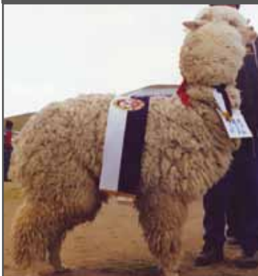
Figura 4. Alpaca huacaya