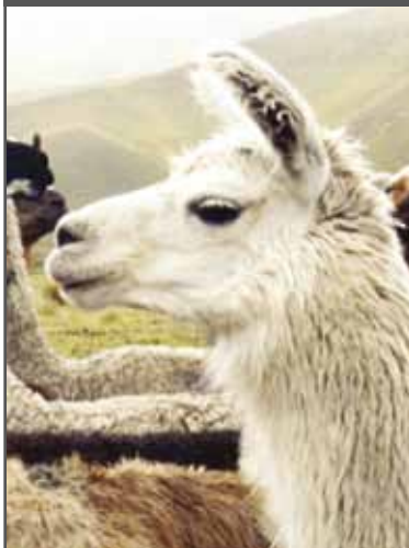
Figura 75. Cabeza mala