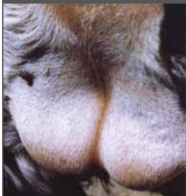
Figura 10. Hiperplasia testicular