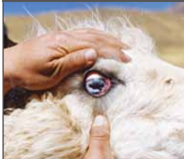
Figura 18. Ojo zarco