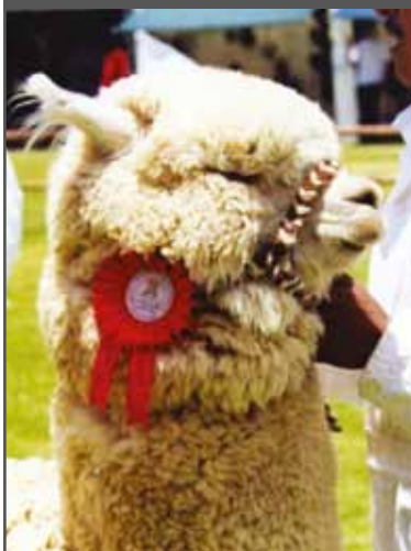
Figura 39. Buena cabeza huacaya