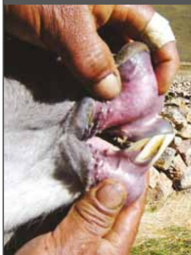
Figura 33. Cuatro dientes