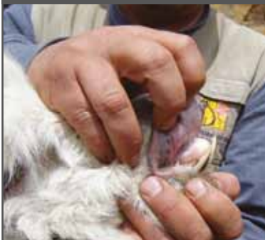
Figura 19. Prognatismo inferior