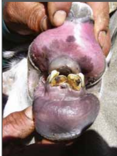
Figura 32. Dos dientes (cambiando)