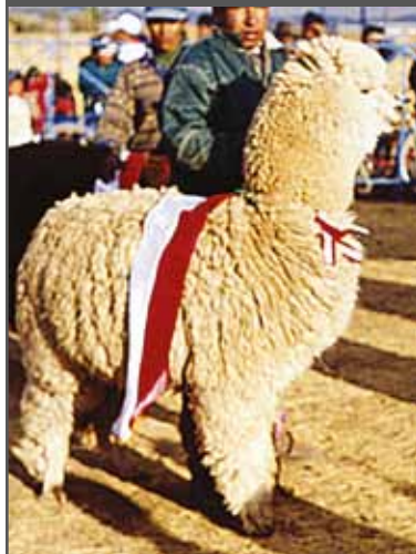
Figura 63. Buena cobertura (huacaya)