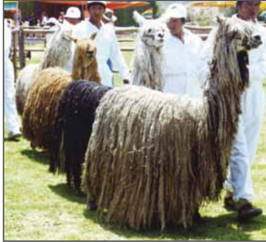
Figura 78. Suri wasi