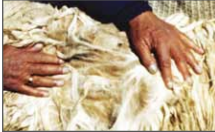
Figura 68. Vellón apelmazado y desordenado