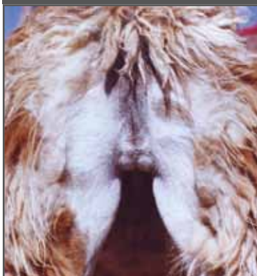
Figura 9. Hipoplasia marcada bilateral