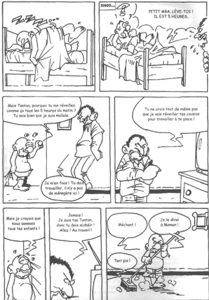
Le droit d'être enfant