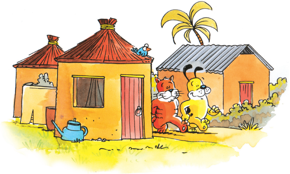
chat et chien marchent ils marchent dans leur village